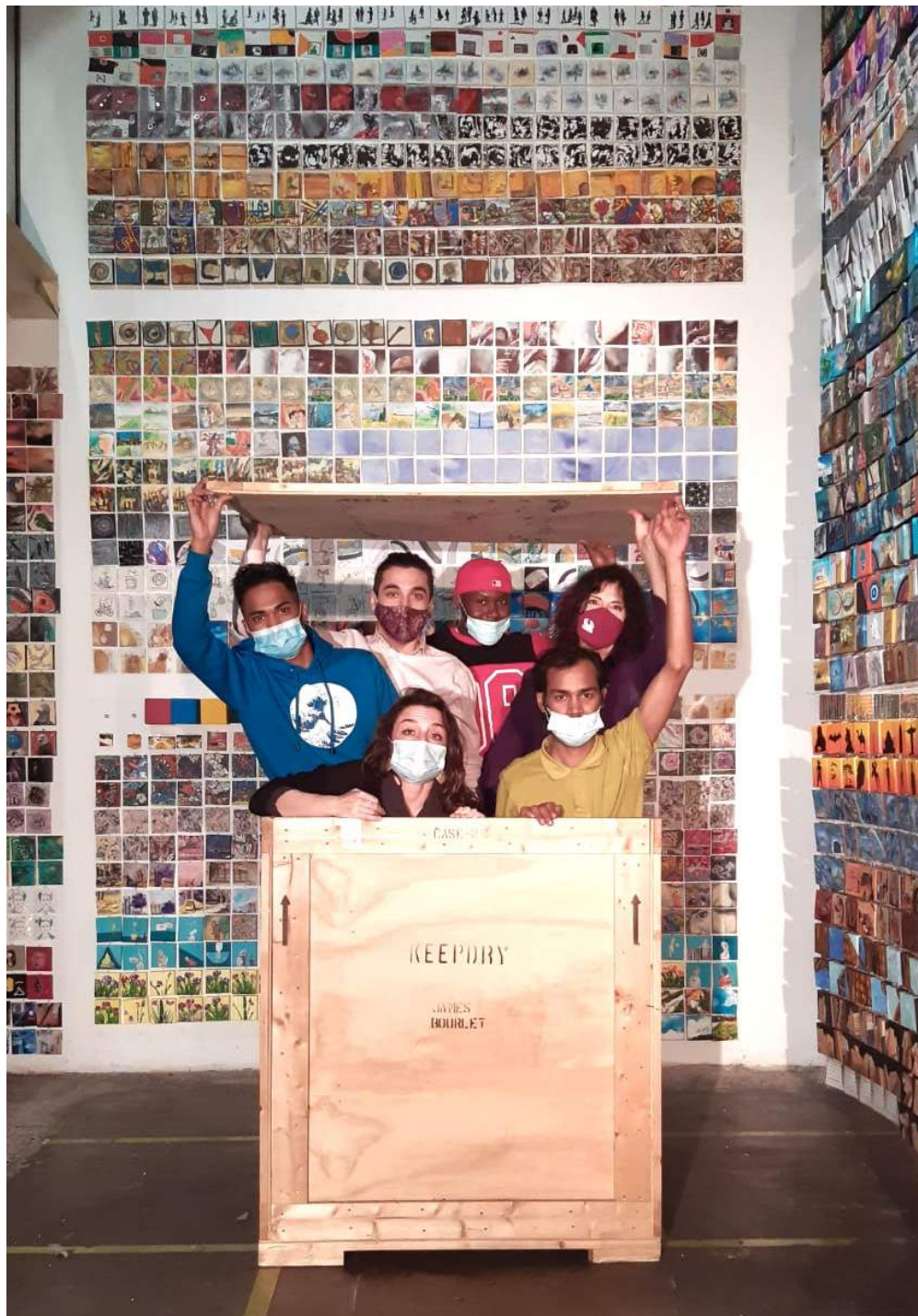
Adotta un Artista